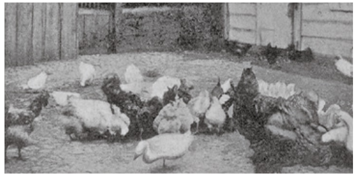
Grupa drobiu w Prażmowie Dobra Gospodyni nr 44 z 1903 roku

Izabella schowała suknie, zapomniała o salonach literackich, postawiła na hodowlę świń i ptactwa domowego. Miała kury, indyki, bazanty, gęsi