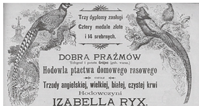
Reklama dóbr Prażmów Dobra Gospodyni z 1902 roku